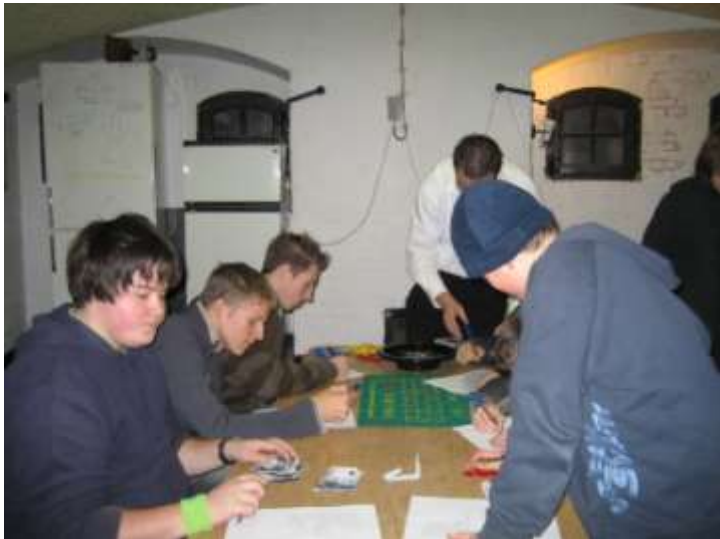
Knakworsten en Casino Royale